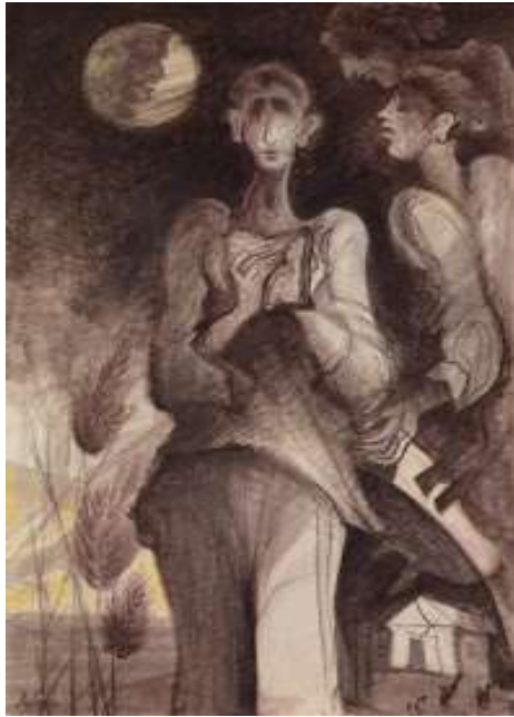
Πίνακας Γιώργου Κόρδη Μια εικαστική ανάγνωση της ποίησης του Καρυωτάκη