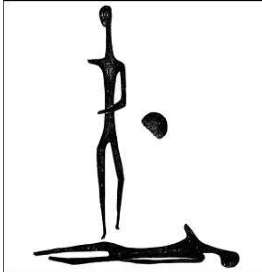
Χαρακτικό Βάσως Κατράκη

12. ...κι η φρίκη δεν κουβεντιάζεται γιατί είναι ζωντανή γιατί είναι αμίλητη και προχωράει~ στάζει τη μέρα, στάζει στον ύπνο ..... πόνος, γράφει ο Γιώργος Σεφέρης στον Τελευταίο Σταθμό .