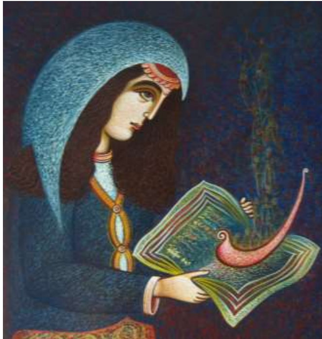
Πίνακας Σοφίας Αμπερίδου