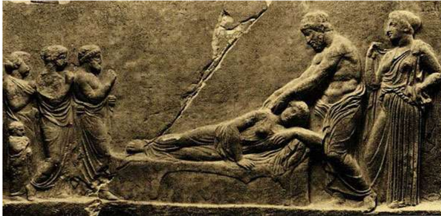
Ο Ασκληπιός και η Υγεία επισκέπτονται μια πάσχουσα γυναίκα(4ος αιώνας π.χ.). Αρχαιολογικό Μουσείο Πειραιά