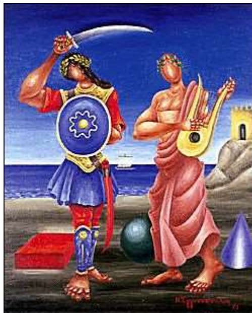
Πίνακας Νίκου Εγγονόπουλου