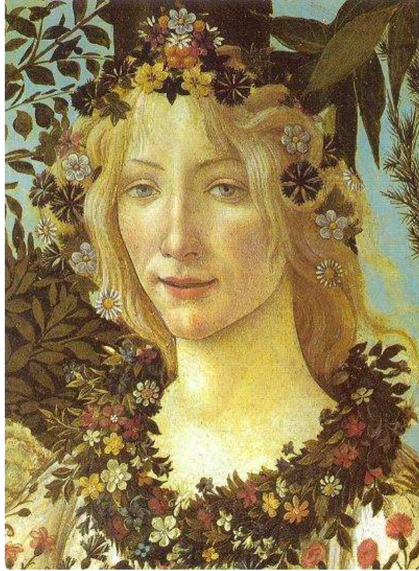
Άνοιξη Σάντρο Μποτιτσέλι

3. Η απόδοση δικαιοσύνης χωρίς εκδικητική ..... είναι δείκτης ποιότητας του ανθρώπινου βίου. Αν δεν αποδοθεί δικαιοσύνη, συνετή, νηφάλια, αμερόληπτη, δεν κατορθώνεται συνοχή της κοινωνίας. Και δίχως κοινωνική συνοχή αποκλείεται νομοτελειακά η ανάκαμψη, αποκλείεται η ελπίδα για ιστορική επιβίωση.